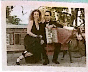
LE «FOLK» STASERA In occasione del Locus Festival, venerdì 14, un concerto con l'Assemblea di direzione artistica di Bitonto, in

Segnala le tue attività artistiche e le tue iniziative nel campo dello spettacolo e del divertimento a: cultura.e.spettacoli@gazzettamezzogiorno.it