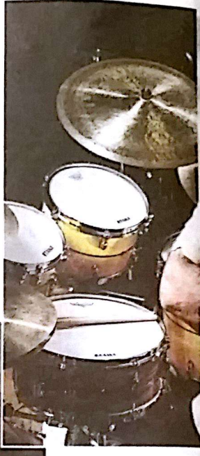
PEZZI DA NOVANTA La cantante e pianista Diane Schurr e il grandissimo batterista Peter Erskine due dei colossi del jazz e della fusion del Beat Onto Jazz Festival

fra il panorama internazionale e il panorama locale», commenta Emanuele Dimundo, presidente dell'associazione In Jazz, ente organizzatore del festival. Il mix, a parere, è indovinato se è secondo quanto raccontano gli organizzatori, il Beat Onto è il festival in cui i musicisti possono vendere più cd. Inizia dunque martedì 1° con Maurizio Rolli, già passato del Beat Onto a la California Dream che vanta, alla batteria,